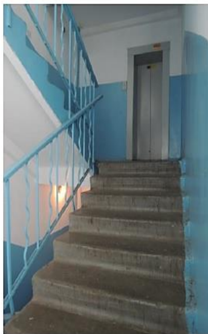
Фотография подъезда – вид 1