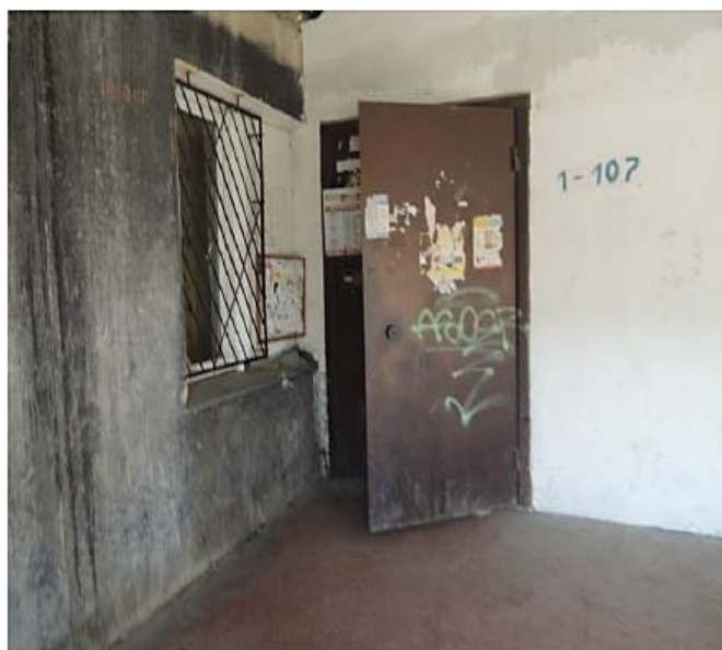
Фотография вход в подъезд