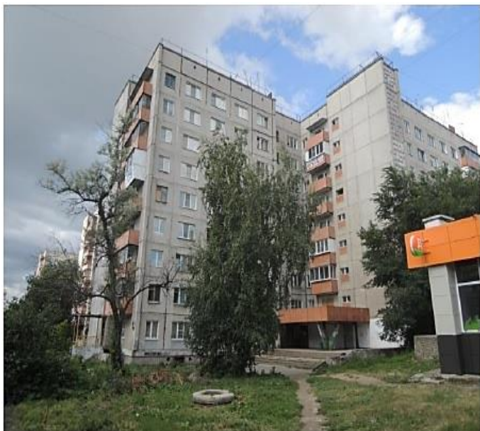
Фотография фасад дома