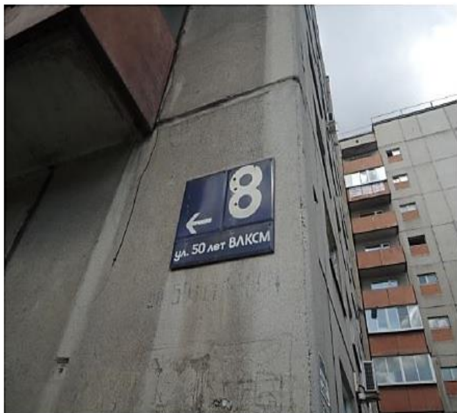
Фотография информационная табличка