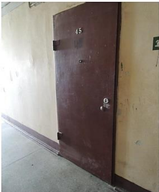
Фотография дверь в квартиру